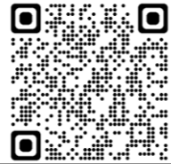
槻寿苑ホームページ QRコード

無料バス（火曜日～金曜日）もあります。 毎日、コースが変わります。 槻寿苑のホームページから時刻表をご覧ください。 詳しくは、お問い合わせ下さい。